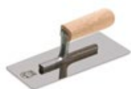
металлический шпатель (кельма)