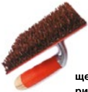
щетка для нанесения рисунка