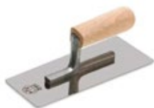
шпатель металлический (кельма)