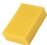
натуральная морская или синтетическая губка